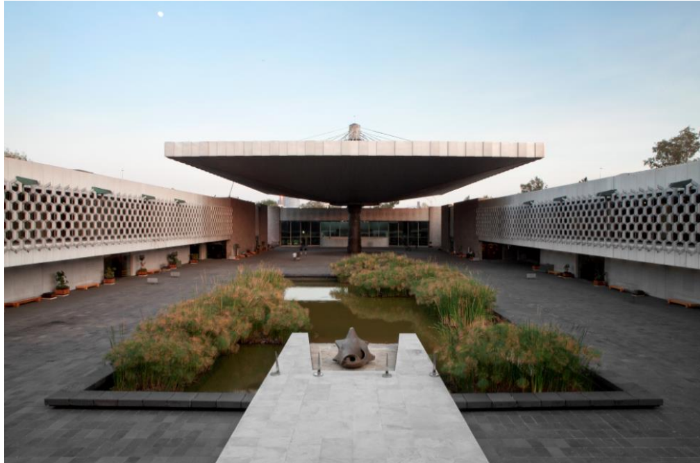
Patio central del Museo Nacional de Antropología desde la Sala Mexica

Martes 10 de junio de 2014 10 hrs. Visita guiada al Museo Nacional de Antropología Actividad opcional en el marco del curso de verano Memoria y Cultura Artística en México , organizado por el Departamento de Arte – IBERO CM