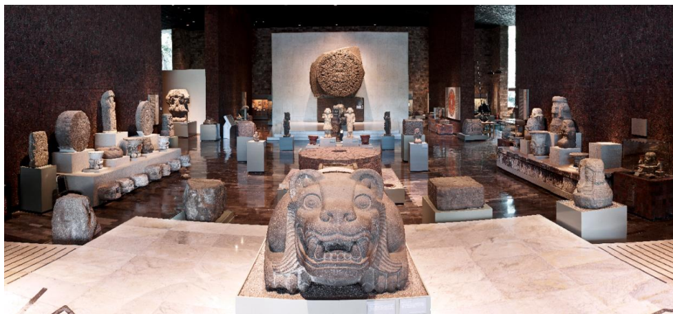
Sala Mexica del Museo Nacional de Antropología

Proyecto de Digitalización de las Colecciones Arqueológicas del MNA. CONACULTA – INAH - Canon, MNA