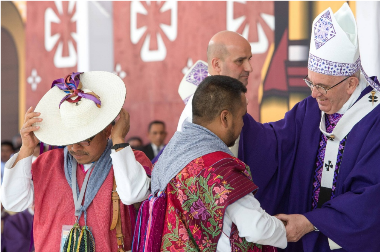
El Papa el 15 de febrero en San Cristobal de las Casas, Chiapas en México, pide dignidad para los indígenas

De hecho, el Papa visitó la frontera norte de México -un gesto-, y sus palabras en la homilía fueron consecuentes con su posición en defensa de los migrantes y su dignidad.